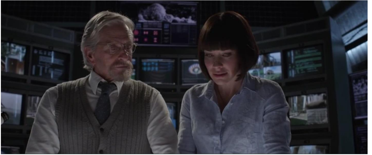
ГЕНК ПІМ ТА ГОУП