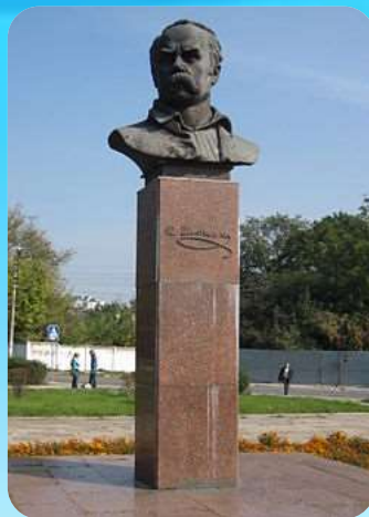
Пам'ятники Т. Г. Шевченка у м. Бендер у Молдові