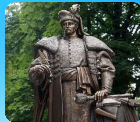
Пам'ятники Пилипа Орлика у м. Бендер у Молдові