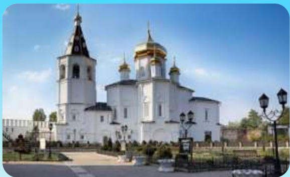
Троїцький монастир в Тюмені